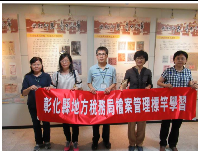
※本局參訪人員至台中市政府地方稅務局標竿學習。