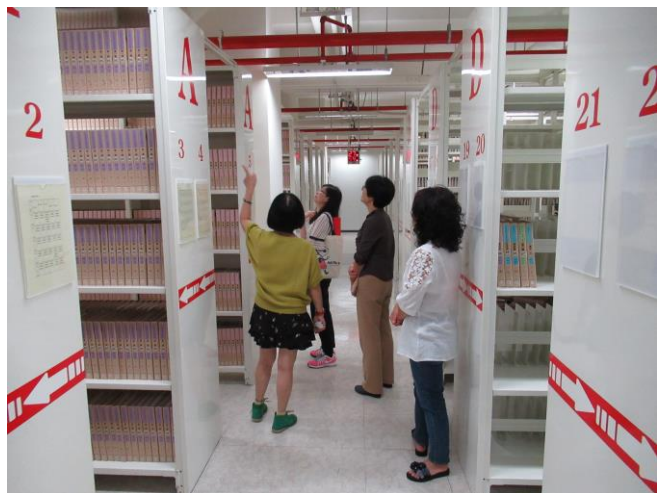
※本局檔管人員參觀財政部中區國稅局台中分局庫房。