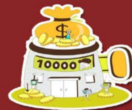
金融機構 (不含郵局)