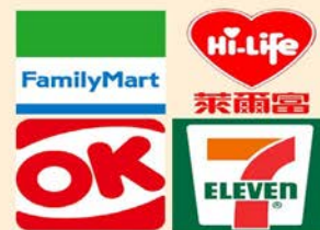
便利商店 (2萬元以下現金)